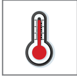
150°C (302°F) - 160°C (320°F)