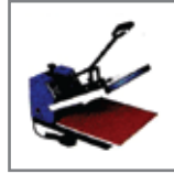
4 Bar pressure 4 Bar basınç