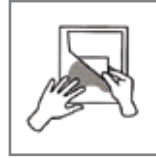
COOL Peel Soğuk çekim