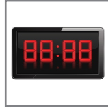
12 seconds for pressing 12 saniye presleme